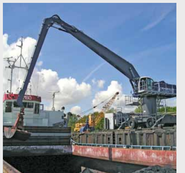
Schiffsendladung mit einem ATLAS Mobilbagger, ausgestattet mit Turmerhöhung und einer Wartungsbühne.