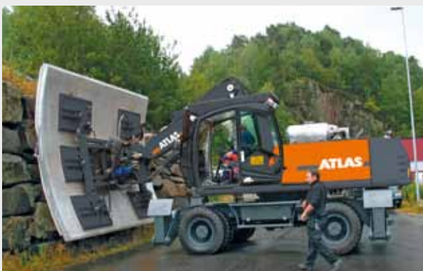
Handhabung von Tunnelrohrschalungen mittels Vakuumanlage mit 22 to ATLAS Mobilbagger