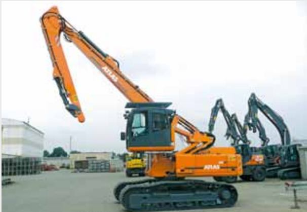
Grungerät 340LC: Spezialraupenbagger mit 2,5 m hoch- und vorfahrbarer Vario-Kabine und gestrecktem Monoarm. Der Bagger wird zur Uferbefestigung an der Küste eingesetzt, deshalb hat er eine Seewasserbeständige Lackierung erhalten und alle Zylinderkolbenstangen sind aus Ni-Ro Vollmaterial in unserem Werk in Vechta gefertigt.